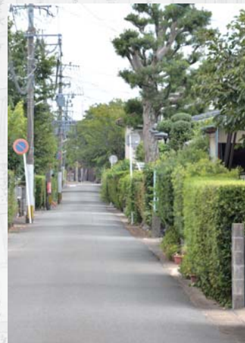
榎の生垣が残る小城・鯖岡小路