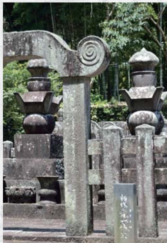
星巖寺 小城鍋島家御霊屋