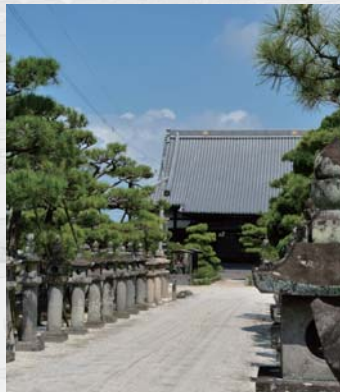
本行寺(白石鍋島家菩提寺)

初代佐賀藩主鍋島勝茂公の長男・元茂公が最初の分家である小城鍋島家を創設し、今年で400年を迎えます。これを機に、勝茂公と子供たちゆかりの地を探訪。勝茂公の嫡男忠直公の早世により、2代藩主はその子光茂公が継ぎましたが、忠直公以外の息子たちの多くは分家を創設し、姫君は藩内の重臣家に嫁ぎました。勝茂公が佐賀城や城下を整備した時期の様子を表した古地図を片手に、城内をはじめ、勝茂公の四男直弘公を祖とする白石鍋島家の菩提寺・本行寺などを探訪します。