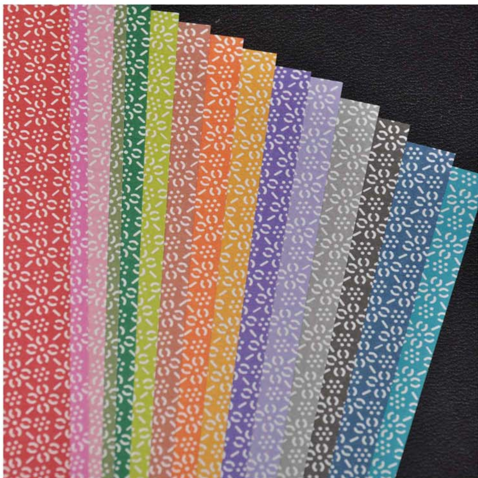
和風の落ち着いた15色(各1枚入り)