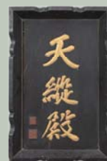
天縦殿扁額 鍋島宗茂 筆 享保10年(1725)