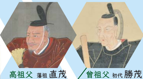
高祖父 藩祖 直茂