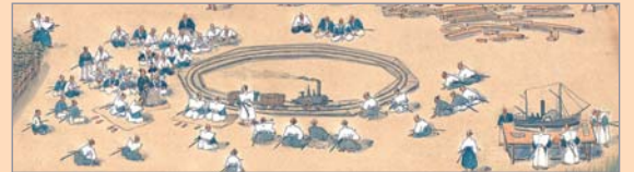
佐賀藩精煉方絵図(部分) 昭和2年(1927) 陣内松齢 筆

明治5年(1872)10月14日、新橋・横浜間を結ぶ鉄道が開業。蒸気機関車で人や物資が運ばれ、人々の生活は劇的に変わっていくこととなりました。